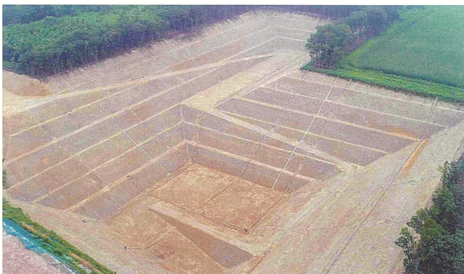
(株)IWD栃木最終処分場拡張部