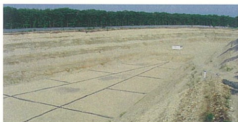
(株)IWD栃木最終処分場B工区