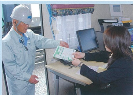
マニフェストの確認