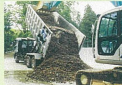
受入れ廃棄物の埋め立て作業風景