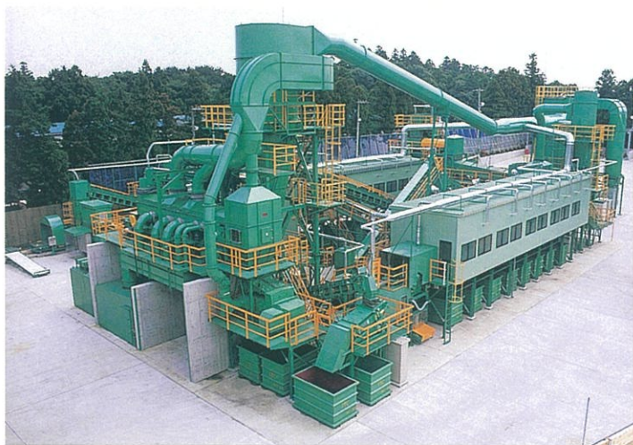
千葉工場 中間処理リサイクルプラント