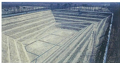
(株)IWD栃木最終処分場A工区