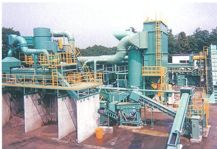
神奈川第1工場 中間処理リサイクルプラント