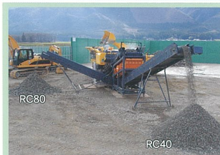
生 成 (RC40, RC80)